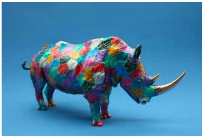
Le rihno bronze coloré