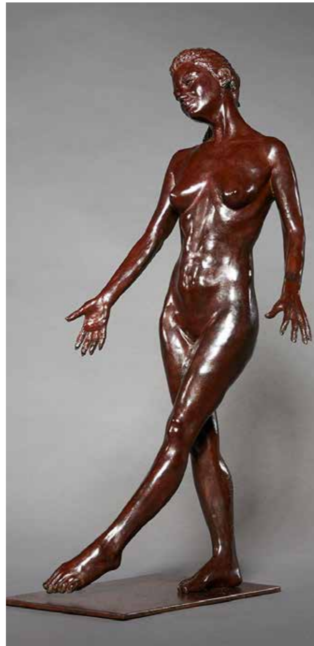
Séduction bronze 14