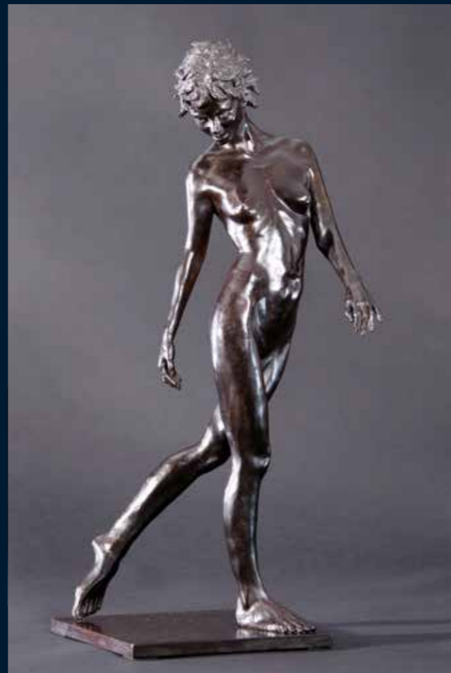
Attirance bronze 11