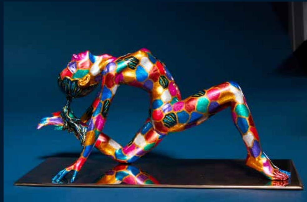
Énergie bronze coloré