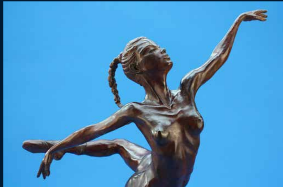
Arabesque bronze et résine colorée