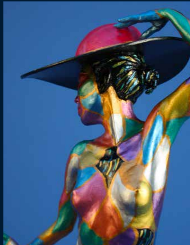
Élégance résine colorée