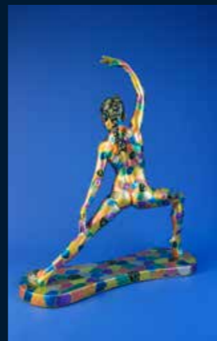
La Guerrière bronze et résine colorée