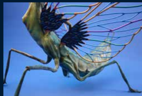
Mante religieuse bronze coloré