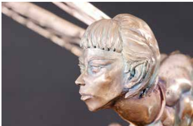
Libellule bronze bronze & argentures