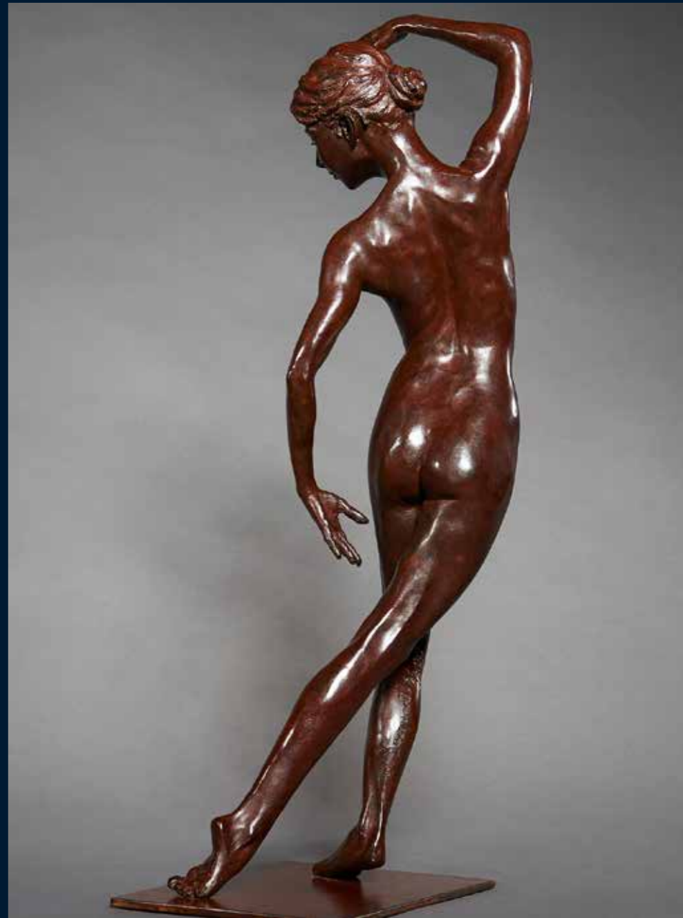
Harmonie bronze 13