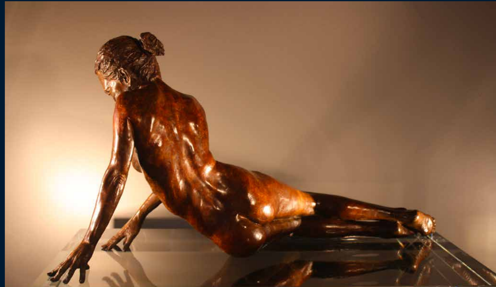
Nascentia bronze 15