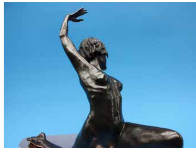
Son of Anjani bronze