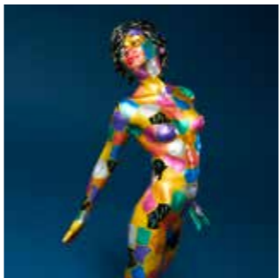
Abandon bronze coloré