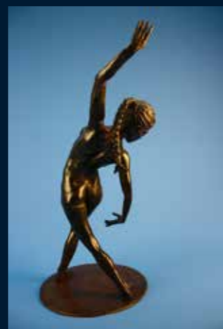
Danse de parvati bronze