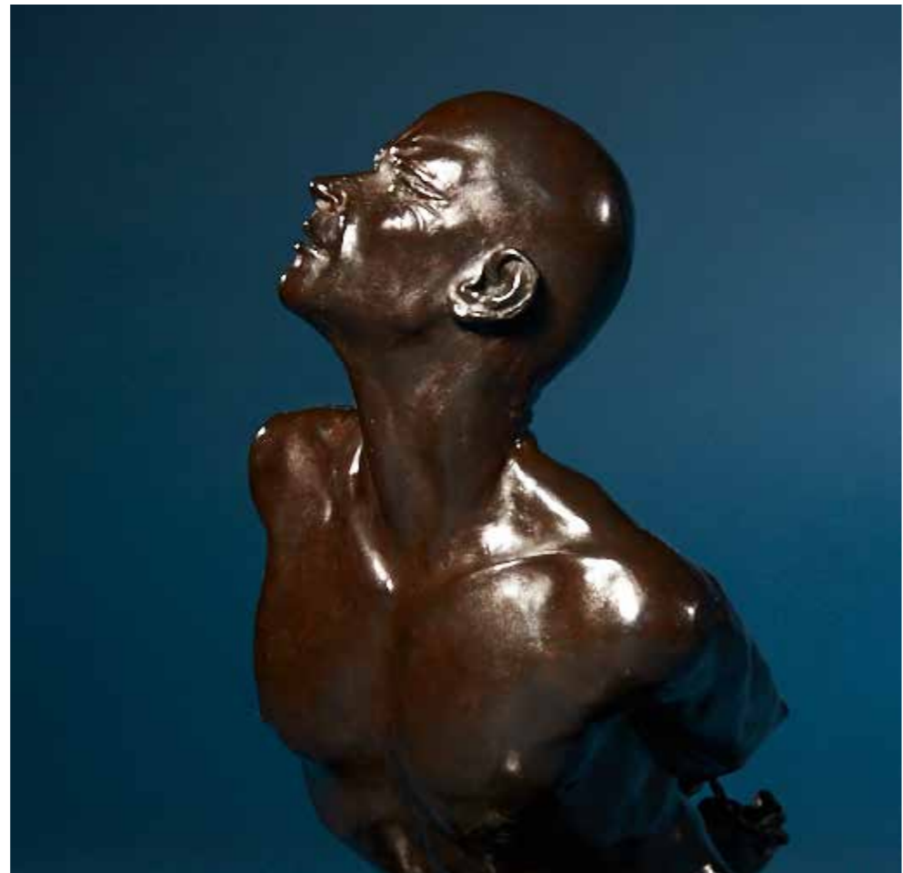
Le prisonnier bronze