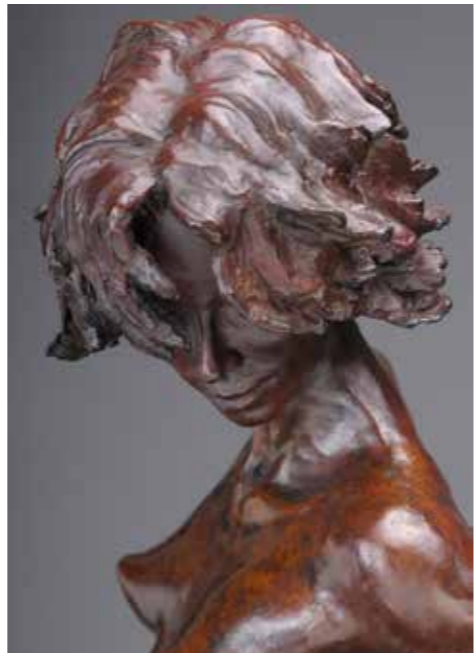
Équilibre IV bronze