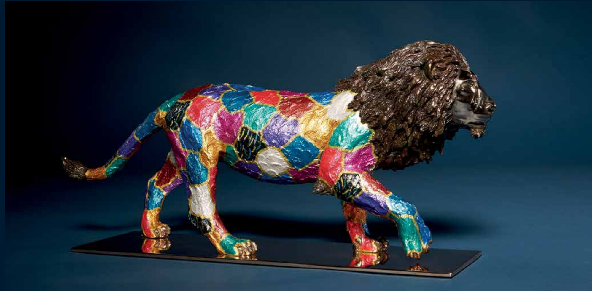
Le lion bronze coloré