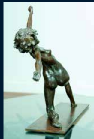
Équilibre V bronze