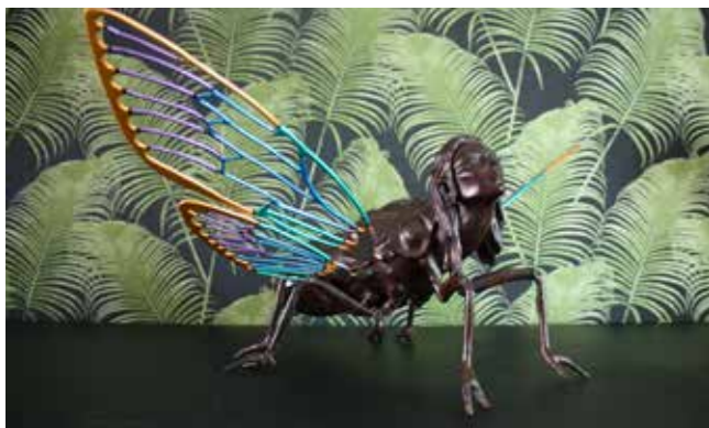
Cigale bronze coloré