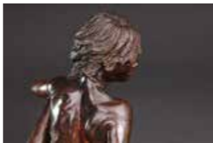
Tendresse bronze 12