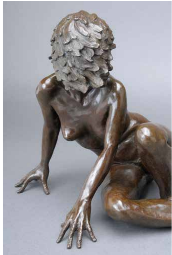
Soupçon bronze 10