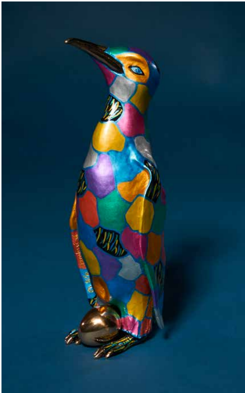
Le manchot bronze coloré