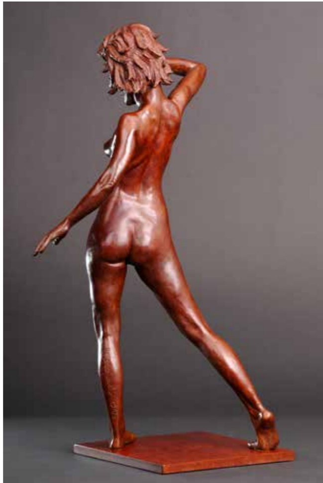
Confrontation bronze 20