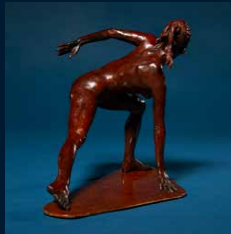
Elodie bronze 21