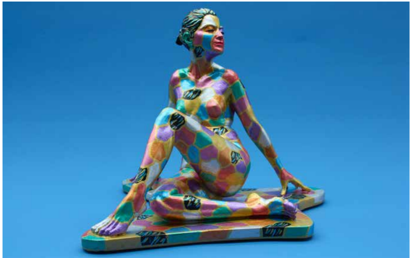
Aurore bronze et résine colorée