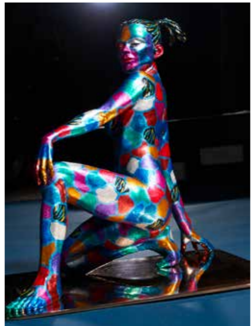
Fierté bronze coloré